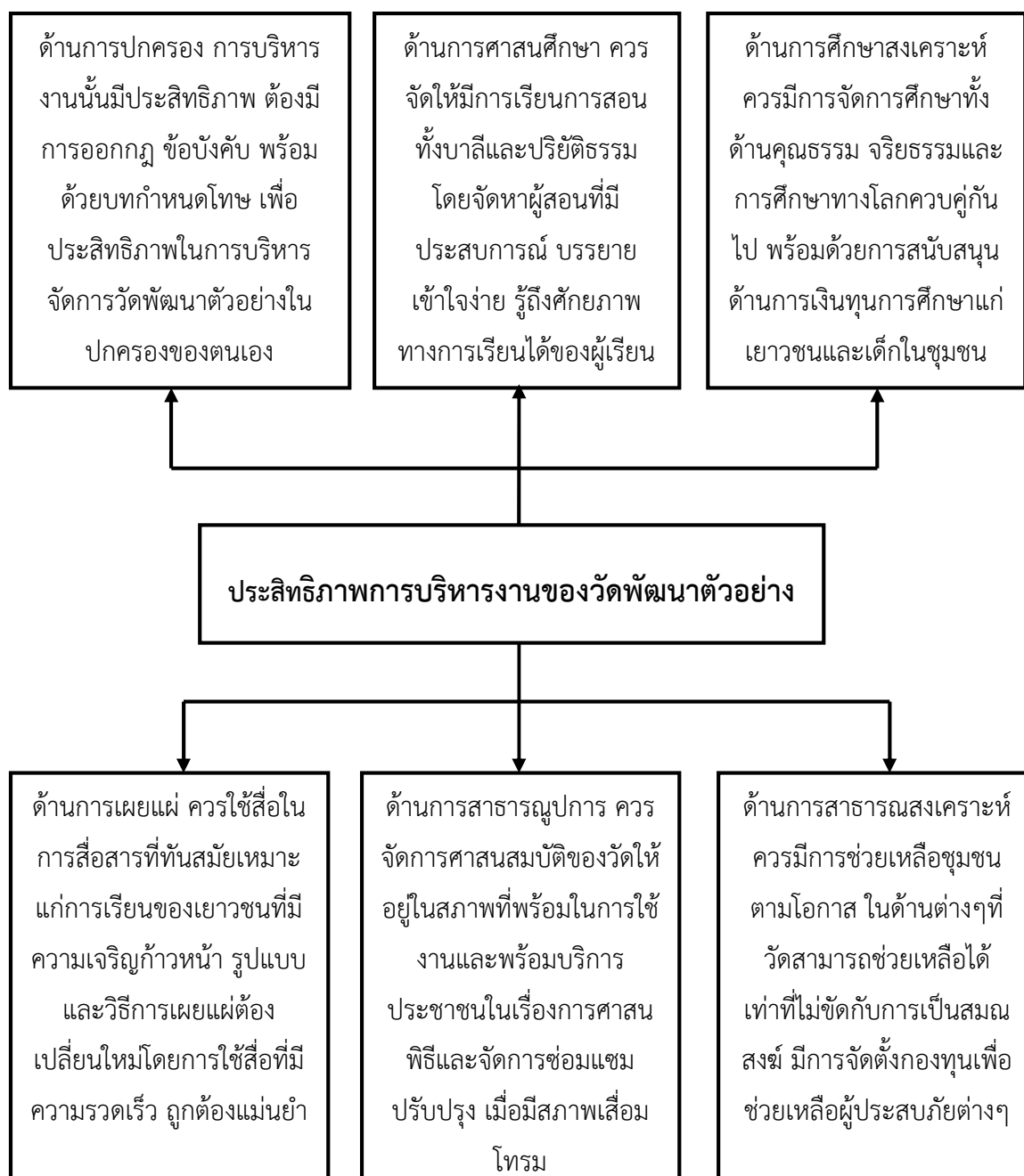
แผนภาพที่ ๔.๑ แสดงองค์ความรู้ที่ได้รับจากการวิจัย

จากการวิจัยเรื่อง “ประสิทธิภาพการบริหารงานของวัดพัฒนาตัวอย่างในอำเภอลาดหลุมแก้ว จังหวัดปทุมธานี” ผู้วิจัยได้นำผลการวิจัยมารวบรวมสรุปในรูปแบบความสัมพันธ์เชิงแผนภาพ ดังนี้