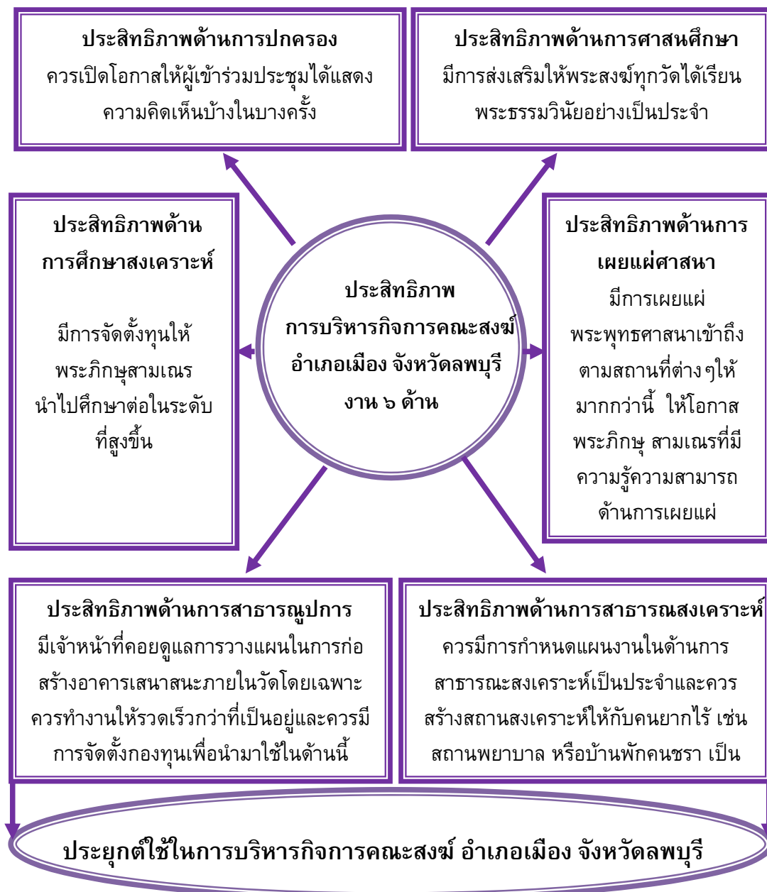
แผนภาพที่ ๔.๑ สรุปองค์ความรู้ที่ได้จากการวิจัย

จากการศึกษาเกี่ยวกับประสิทธิภาพการบริหารกิจการคณะสงฆ์ อำเภอเมือง จังหวัดลพบุรี ผู้วิจัยสรุปองค์ความรู้ (Body of Knowledge) ดังแสดงในแผนภาพที่ ๔.๑